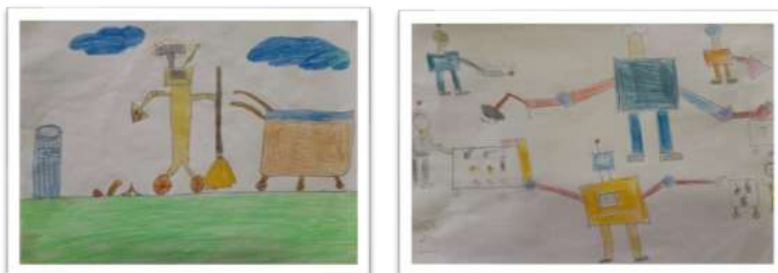
شکل ۵ نمونه نقاشی با مضمون آموزش بهداشت و افزایش آگاهی مردم