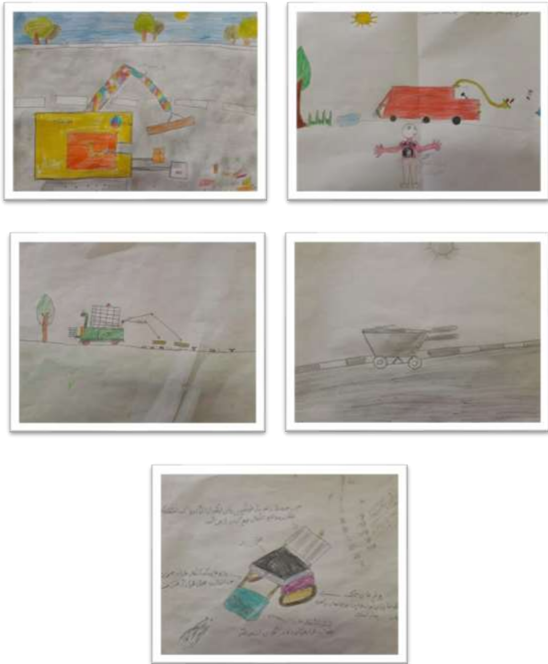
شکل ۱ نمونه نقاشی با مضمون بهینه‌سازی فناوری جمع‌آوری و حمل و نقل مواد زاید جامد