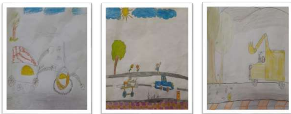
شکل ۳ نمونه نقاشی با مضمون توجه به امر بازیافت زیاله