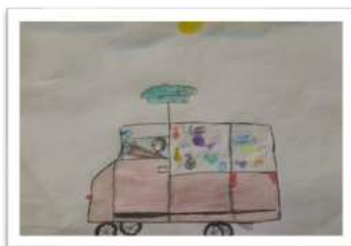
شکل ۴ نمونه نقاشی با مضمون ایجاد فرهنگ تولید کمتر زیاله